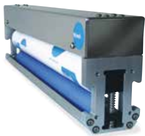
SLn / SLmax / SCH 产品图 无护罩，无滑轨